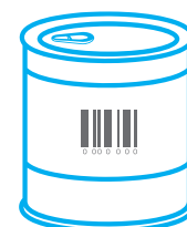
Inspección de todo tipo de códigos

TEC S.A.S adapta sus soluciones para dar respuestas a las necesidades específicas de cada cliente.