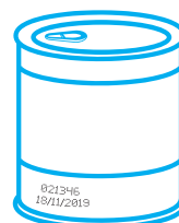
Impresión con inkjet